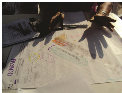
Imagen 6. Taller de cartografía social.