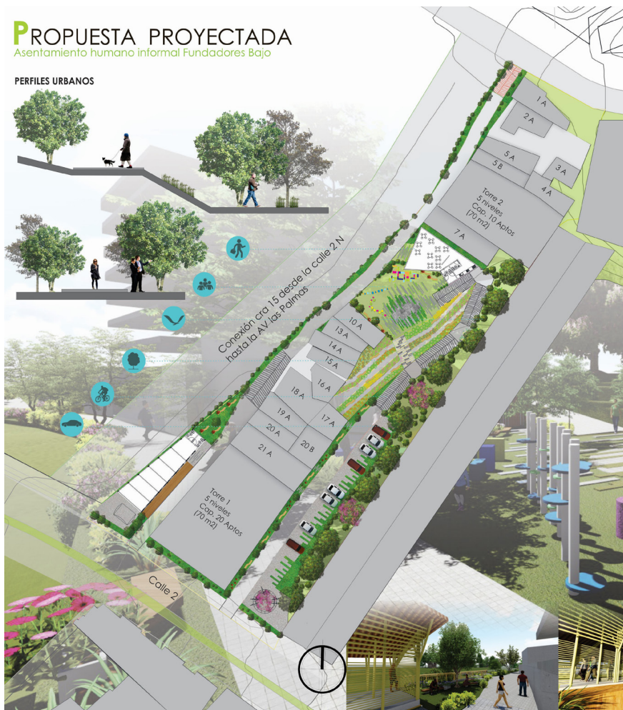
Imagen 9. Planta general propuesta proyectada.

Largo plazo. La segunda propuesta plantea (de manera complementaria a la anterior) la adecuación del acceso vehicular y parqueaderos para el uso de la comunidad, según la normativa urbana que rige al sector (imagen 9). Además, algunas de las viviendas serán mejoradas en aspectos estructurales y de fachada, mientras que otras serán relocalizadas dentro del mismo asentamiento facilitando su densificación habitacional. Para ello se proponen nuevas edificaciones de cinco niveles de altura con apartamentos de 70 m 2 , que alberguen de manera digna a todos los actuales habitantes de la comunidad. A nivel urbano, esta propuesta promueve la creación de zonas que fortalezcan la conectividad entre los habitantes y espacios de estancia que complementen recorridos naturales. De manera similar, se sugiere la ubicación del salón comunal en un área central, con capacidad para más de 50 personas, dispuesto para múltiples eventos. A su alrededor se plantea la ubicación de la huerta comunitaria y un parque infantil, los cuales permitirán que las personas se involucren en las dinámicas del lugar y adquieran mayor apropiación. Finalmente, para conservar la memoria del lugar, se propone recuperar antiguas zonas de siembra, cultivadas anteriormente por algunos pobladores.