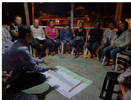
Imagen 1. Socialización inicial del proceso investigativo con la comunidad.

El desarrollo de las fases mencionadas contó con la participación activa de la comunidad, siendo esta fuente primaria de información y con quien se realizaron jornadas de ejercicios participativos y devolución permanente de resultados, en consonancia con los postulados metodológicos de la Investigación-Acción-Participación (IAP), en donde se genera conocimiento que promueve los cambios que las comunidades requieren (Fals Borda 1993). Con el estudio se establecieron las condiciones de vida de los habitantes; se produjo un diagnóstico situacional comunitario y dos propuestas urbano-arquitectónicas planteadas de forma participativa para el corto y largo plazo.