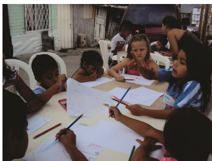
Imagen 5. Taller de dibujo y color.

Para ello, luego del análisis de resultados obtenidos, se elaboraron técnicamente las propuestas urbano-arquitectónicas, las cuales están concebidas con la temporalidad y posibilidad de su ejecución por parte de diferentes actores en programas de mejoramiento integral de barrios. Las mismas se concibieron teniendo como referencia la norma urbana establecida para la ciudad y se plantearon tanto para espacios colectivos como para espacios privados en dos escenarios de ejecución: el primero, a corto plazo, con el fin de viabilizar la legalización del asentamiento y, el segundo, a largo plazo, una vez que se puedan realizar intervenciones en el lugar.