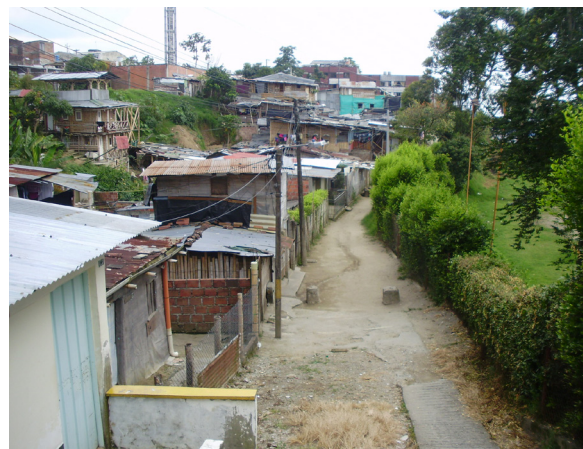
Imagen 4. Panorámica del asentamiento Fundadores Bajo.

Los resultados también arrojaron que el 66% de las viviendas se encuentran con posibilidades de colapso y, en ese mismo porcentaje, de sufrir fuertes consecuencias en caso de vendavales. Se concluye que los principales factores de vulnerabilidad frente a un posible riesgo son la materialidad de las construcciones, la falta de acceso vehicular adecuado en casos de emergencia junto con la ausencia de planes preventivos comunitarios y, en casos aislados, la cercanía a zonas de ladera.