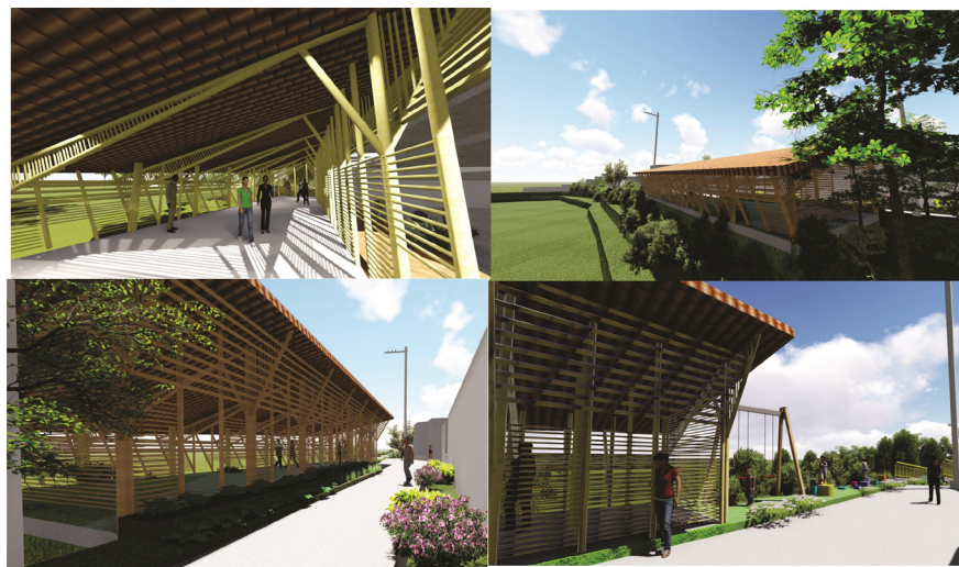
Imagen 8. Perspectivas de la caseta comunal propuesta (fuente: Elaboración propia).