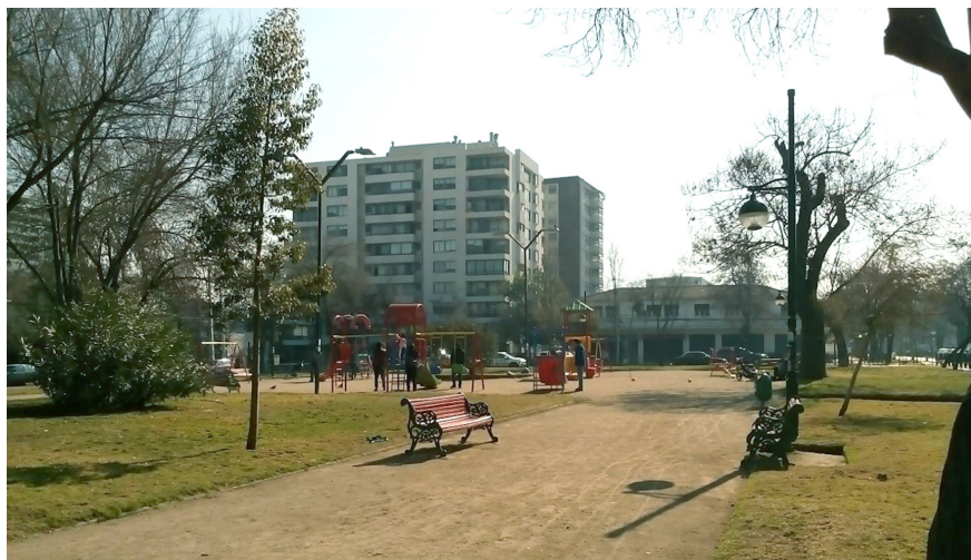
Imagen 1. Plaza Guillermo Franke, Ñuñoa, Santiago de Chile, durante el año 2018. La disposición formal del mobiliario urbano impide su uso.

Por lo tanto, el interés de esta investigación es enfocarse en las relaciones interpersonales, sociales y ciudadanas que se dan en los espacios públicos, ya que son factores clave del bienestar de las personas (Dziekonski et al. 2015). Tanto desde la psicología ambiental como desde la antropología y la arquitectura, se ha reconocido la importancia del diseño de los espacios urbanos en el goce de las personas con su entorno (Zimmermann 2010; Groat y Wang 2002). A partir de la interdisciplinariedad, es posible una mirada capaz de incluir la subjetividad y los significados de las personas en relación a su calidad de vida y los espacios que utilizan, así como la dimensión de la vida social tan necesaria para el bienestar humano (Vázquez-Honorato y Salazar-Martínez 2010). Desde esta perspectiva, se espera contribuir con herramientas, dirigidas tanto a la ciudadanía como a las políticas de Estado, para que las condiciones de diseño de estos espacios se hagan de acuerdo a la necesaria mejora de la calidad de la vida urbana y barrial. Para ello, se busca poner en valor al derecho que tienen, cotidianamente, los usuarios de los espacios públicos en el hábitat urbano, para que estos sean propicios en aportarles satisfacción y calidad de vida, así como promover procesos de integración social y bienestar psicosocial.