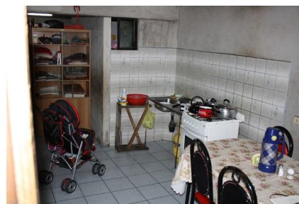
Imagen 3. Ampliación cocina/comedor (fuente: El autor, 2019).