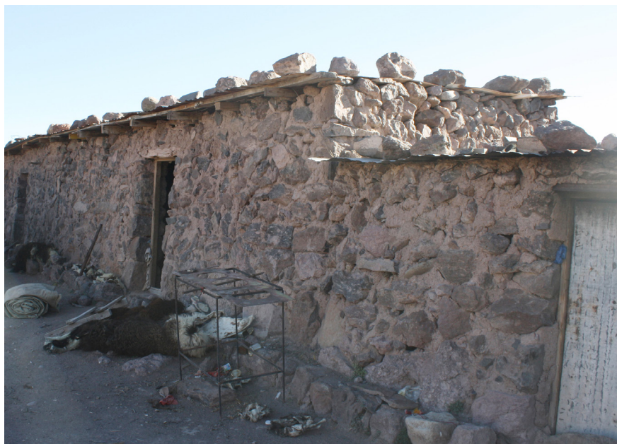
Imagen 1. Vivienda aymara tradicional, la uta.

(González y Gavilán 1990). En este contexto, la vivienda aymara urbana ha jugado un rol importante por cuanto se transforma en un elemento de pertenencia a la ciudad. La relevancia de la idea de propietario ayudó a modificar la relación entre los aymara y el resto de la sociedad residente en Arica. Desde ese universo propio y contenido que representa la vivienda, se estableció una relación con sus vecinos en las etapas iniciales, frecuentemente miembros de una misma comunidad de origen (González 1995). Posteriormente, esto incluyó a grupos sociales más amplios al acceder a la vivienda por medio de soluciones habitacionales que abarcaban segmentos generales de la población, sin detenerse en la pertenencia étnica o en diferencias culturales. Fueron estos barrios de viviendas sociales construidos a fines de la década de 1980 –y en años posteriores– los que terminaron por contribuir a una diversificación en la localización de las familias aymara migrantes. Como resultado,