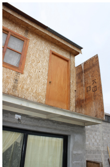
Imagen 2. Vista ampliación tercer nivel.

un modo de habitar único. No se consideró que en el transcurso de los más de 15 años en que estas familias habitaron las viviendas originales, la autoconstrucción dio pie a un importante proceso de ampliación vernácula de las mismas que, como vimos en el caso estudiado, no tan solo duplicó el metraje construido, sino que finalmente terminó por hacer "pertinente" culturalmente hablando. Así, una vivienda originalmente ajena a las necesidades y particularidades de