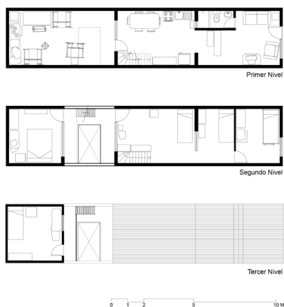
Figura 2. Vivienda ampliada a través de autoconstrucción.

la jefa de hogar, una migrante aymara de 54 años y madre de tres hijos, se alargó durante más de 10 años. En distintas etapas, se agregaron a la vivienda 53 m 2 , de los cuales la mayoría (38 m 2 ) sumaron tres habitaciones adicionales (figura 2). Dos de estos nuevos dormitorios fueron construidos en albañilería reforzada en un segundo nivel y otro, en material ligero en un tercer nivel para acoger temporalmente a familiares que comienzan el proceso de instalación en la ciudad (imagen 2). Además, se realizó la ampliación del primer nivel original, sumando 15 m 2 y generando un espacio diferenciado entre una sala de estar y una cocina/comedor (imagen 3). A este metraje hay que agregar un espacio exterior o patio, de 24 m 2 con un suelo de hormigón, semicubierto por una de las habitaciones en albañilería del segundo nivel. Este espacio exterior, al que conectan todas las habitaciones autoconstruidas, sirve al igual que en la vivienda tradicional de espacio exterior doméstico donde se realizan labores de producción textil artesanal, fuente principal de subsistencia de esta jefa de hogar aymara (figura 3). La capacidad y relevancia del proceso de autoconstrucción de las familias indígenas