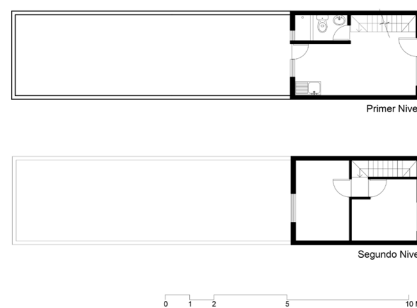
Figura 1. Vivienda original entregada por el Estado.

Como hemos mencionado, la ampliación de la vivienda mediante autoconstrucción es común en todas las familias beneficiadas por soluciones habitacionales estatales. Sin embargo, en el caso de las viviendas aymara urbanas, esta situación termina constituyendo una unidad que presenta características propias del habitar tradicional aymara, trasladadas y adaptadas a la nueva realidad urbana (González 2016). Si revisamos uno de los casos estudiados a modo de ejemplo, nos encontramos una jefa de hogar, migrada a la ciudad de Arica en 1975 a una casa de familiares ubicada en el sector Renato Rocca. En esa década, la ciudad se expandía hacia ese sector con la entrega de sitios con servicios básicos. En 1992 tuvo la posibilidad de ser propietaria por primera vez, cuando a través de los organismos estatales se le entregó una vivienda en el sector Cerro Chuño (figura 1). La unidad original entregada era de 32 m 2 , repartidos en dos niveles, que terminó siendo ampliada en más del doble. El proceso de ampliación realizado por