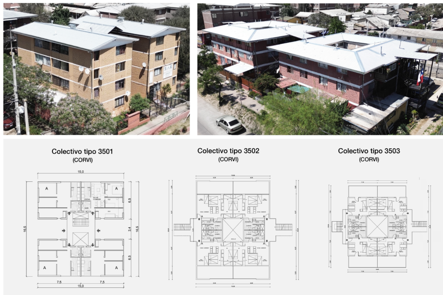
Figura 6. Colectivos regionalizados 3501, 3502 y 3503 de CORVI, fotografías y plantas.