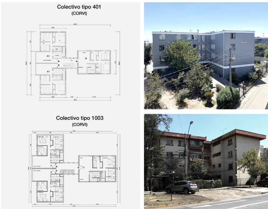
Figura 4. Colectivos 401 y 1003 de CORVI, fotografías y plantas (fuente: elaboración propia a partir de revisión documental y observación en terreno, 2023).

dos y tres viviendas por planta, es agregado dos y tres veces dando forma a volúmenes más amplios que pueden cubrir la extensión de una cuadra. Los códigos que identifican su tipos y variaciones se ubican en el rango entre 1000 y 1010, pero no se logró obtener planos de todos los tipos o documentos que dieran cuenta de ellos a pesar de una exhaustiva búsqueda en archivos y biblioteca. El primer modelo para el cual se obtiene información es el colectivo tipo 1002, que presenta una planta de tres viviendas adosadas de manera compacta en torno a una circulación central. Su forma y la superficie de las viviendas es similar a las de los colectivos 1006 y 1007, pero sus plantas difieren entre sí pues en estos últimos las zonas húmedas se encuentran en torno a la caja de las escaleras, lo que no ocurre en el 1002 (figura 3).