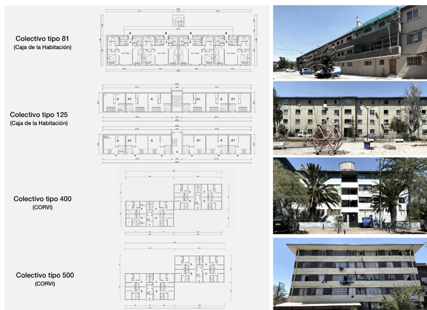
Figura 2. Plantas e imágenes de Colectivos 81 y 125 (Caja de la Habitación), y de Colectivos 400 y 500 (CORVI) (fuente: elaboración propia a partir de revisión documental y observación en terreno, 2023).

Se trata de modelos híbridos entre las dos estrategias anteriores donde un módulo, de