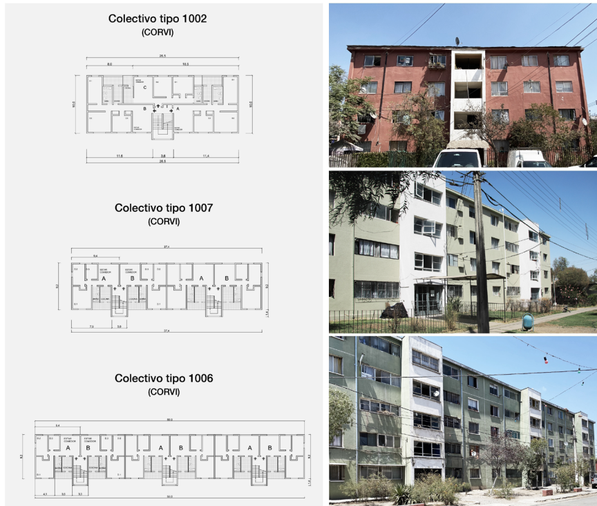
Figura 3. Colectivos 1002, 1007 y 1006 de CORVI, fotografías y plantas.