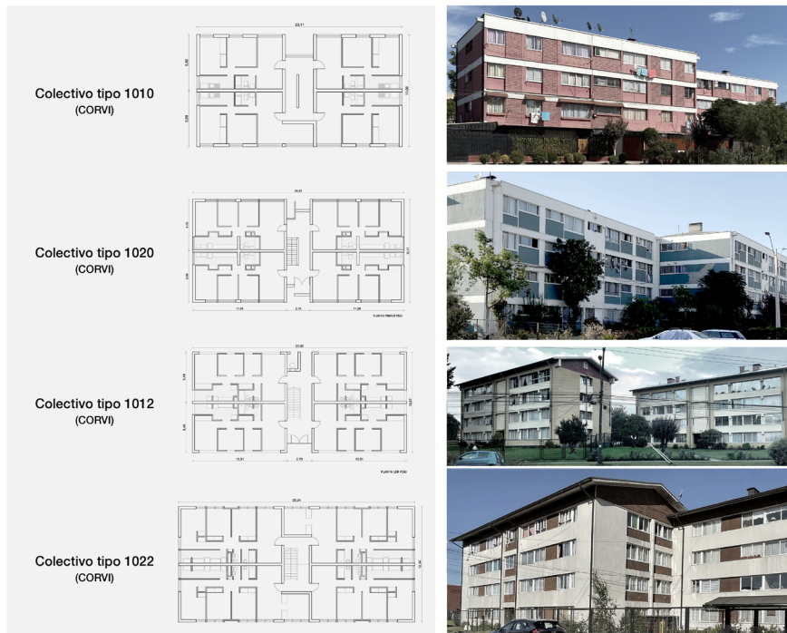
Figura 5. Colectivos racionalizados 1010 y 1020 (Santiago) y colectivos regionalizados 1012 y 1022 (Osorno) de CORVI, fotografías y plantas (fuente: elaboración propia a partir de revisión documental y observación en terreno, 2023).

Los colectivos 3101, 3502 y 3503 marcarán un quiebre tanto en esa regularidad como en su forma, disposición y altura, siendo los primeros modelos que bajan a los tres pisos y que asumen una escalera metálica externa para la circulación en pos de bajar el coste constructivo de los edificios y así incrementar su producción (figura 6). Serán presentados en la Exposición Demostrativa Santiago Amengual, en 1976, para su selección por parte de los gobiernos municipales y su construcción por el Servicio de Vivienda y Urbanismo (SERVIU), la entidad que asumió las labores de CORVI desde el inicio de la dictadura militar y que sigue operativa hoy. En el marco de la Exposición Demostrativa Santiago Amengual, los diseños regionalizados serán apropiados y reinterpretados por las empresas constructoras. En ello es particularmente exitosa la tipología 3101, que tendrá distintas variaciones privadas y cuya estructura modular recuerda –cuando es agregada horizontalmente– a las tipologías