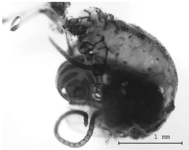
Figura 2. Cinara cupressi parasitado por Pauesia sp. Cinara cupressi parasitized by Pauesia sp.

El pulgón del ciprés actualmente se encuentra distribuido en todo el país, demostrando su gran capacidad invasora y aún se desconocen aspectos importantes de esta plaga en Chile. Por ello se sugiere que a futuro se evalúe en terreno el ciclo biológico del pulgón, dado que en este país no se ha determinado cómo se comporta ni se ha evaluado qué sucede con el pulgón durante la época de verano, período en que las poblaciones del áfido disminuyen de una forma