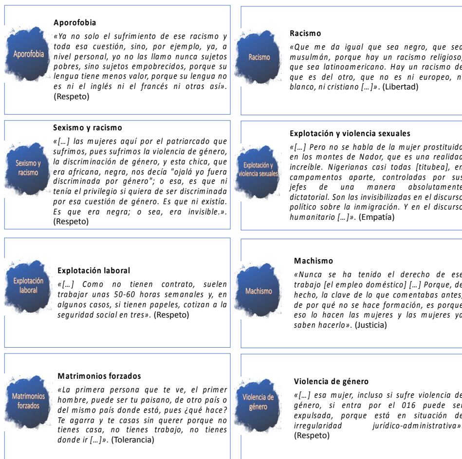
Figura 3. Diferentes tipos de violencias mencionados por los participantes.