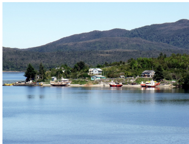
Fotografía: Repollal Alto, comuna de Las Guaitecas, Ricardo Álvarez 2010

Figura 2. Pequeño asentamiento costero en la costa interior de isla Asención, en Las Guaitecas. Gradualmente fue adquiriendo una toponimia, una biografía y un reconocimiento en la cartografía formal. Su nacimiento obedeció al transporte del modelo consuetudinario para fundar este lugar.