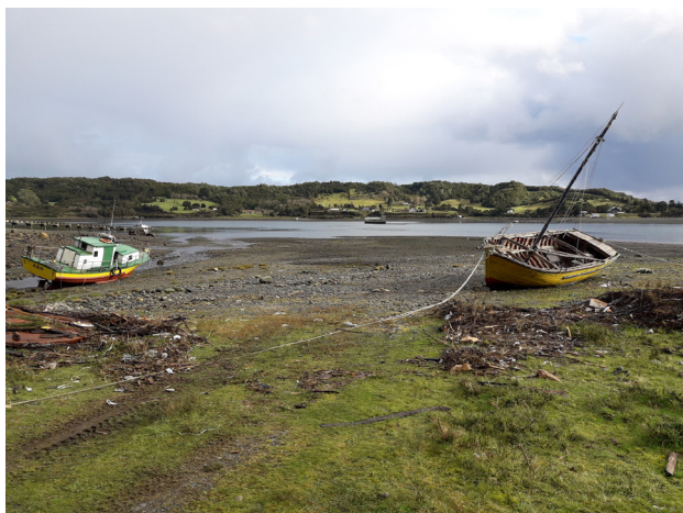
Fotografía: costa interior de Isla Butachauques, Comuna de Quemchi. Ricardo Álvarez 2016.

En tiempos recientes, en el Archipiélago de Chiloé y los Canales Australes -afectados por múltiples amenazas 7 - el concepto de maritorio adquiere un sentido político-territorial estratégico, de vida y de soberanía para sus habitantes (Domenech 2003, Gajardo et al. 2016), siendo utilizado en herramientas de zonificación marina y propuestas de conservación (Hucke-Gaete et al. 2010; Luna 2009; Molina 2013; Torres 2017), o simplemente referido como un espacio reconocible en el que suceden siniestros