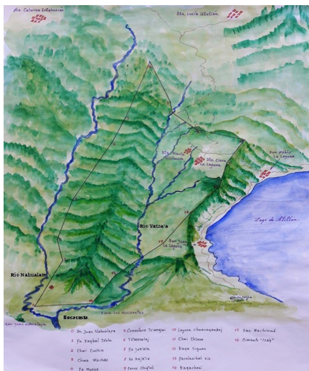
Imagen 1. Mapa ilustrativo de Visitación, según Título de 1739.

A pesar de esta connotación idiomática, las autoridades atitecas dejan clara su postura respecto a la posesión de las tierras: [...] “para que en ningún tiempo quieren los de Santa Clara usurparles algún pedazo de dichas tierras” 9 .