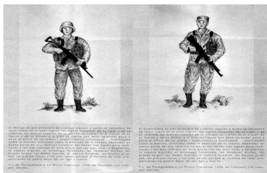
Imagen 2. Exhibición Hawapi

temas humanos como todas las personas de la sociedad civil” (Clavijo y McAllister 2019: 7). La creación de una imagen de sí en el proceso de humanización de los actores del conflicto armado es fundamental para cambiar la forma como se percibe a estos sujetos. Ya no se les va a atribuir el estigma por su modus operandi en el pasado, sino que se los reconocerá según el discurso oficial de estado, por ser sujetos que comparten los mismos temas y valores que la sociedad civil. Además, no se trata ya solamente de una voz militar en torno a las operaciones de guerra, sino del soldado como ser humano hablando de sí mismo. Lo anterior se puede observar en una impresión entregada en la exhibición Hawapi de la galería Espacio el Dorado. 17