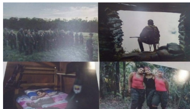
Imagen 1. La esperanza vence al miedo

En algunos museos, pueden encontrar producciones en las que se da cuenta del reconocimiento de las características y cualidades de los excombatientes como seres humanos. Por medio de fotografías, pinturas y dibujos se ponen en evidencia aspectos como su formación en la selva, sus actividades cotidianas, los lazos familiares, el vínculo con sus compañeros, entre otros. Esto se puede observar en las siguientes fotografías pertenecientes a la exposición La Esperanza Vence al Miedo , en el Museo Nacional de Colombia (2017). 16